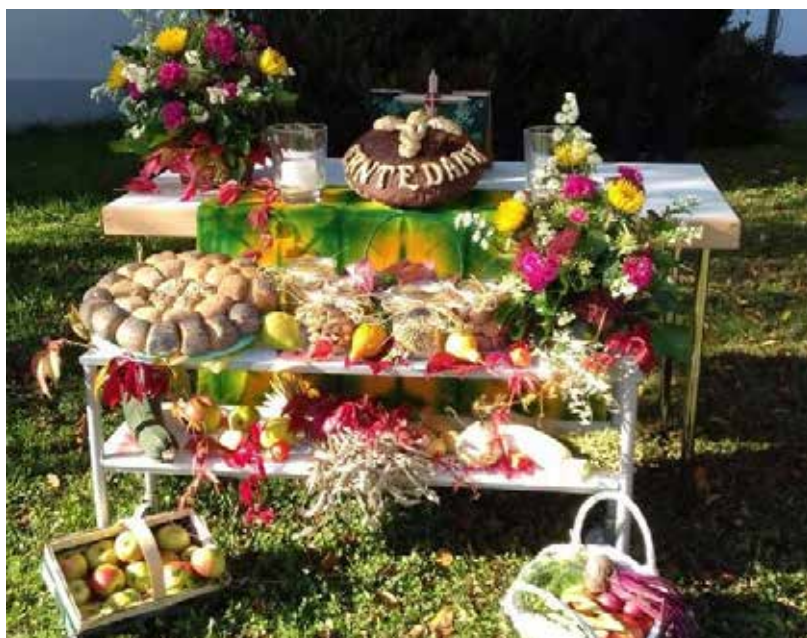
Oben: Erntedank in der Fried- enskirche Hemau